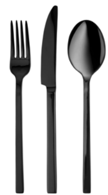
Schwarz (poliert) black (polished)