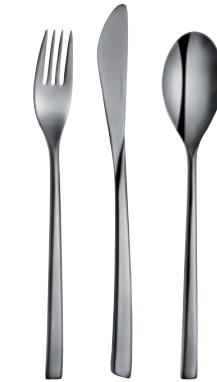
Anthrazit (poliert) Gun metal (polished)