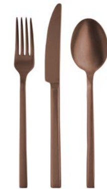
Kupfer Stonewashed copper stonewashed