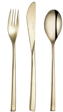
Hellgold (poliert) Pale gold (polished)