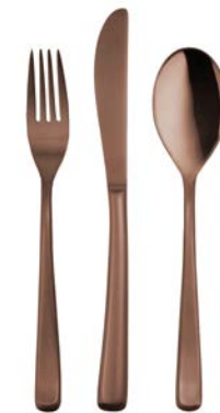
Kupfer Gebürstet copper brushed