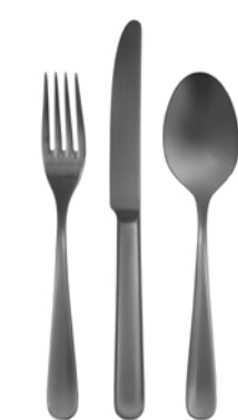
Anthrazit Gebürstet gun metal brushed