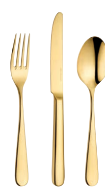
Gold (poliert) Gold (polished)

LAGERHALTIG sofort lieferbar VPE 12 Stück. ON STOCK immediately available unit 12 pieces