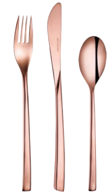
Kupfer (poliert) Copper (polished)