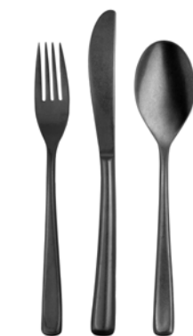
Anthrazit Stonewashed gun metal stonewashed