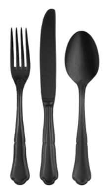
Schwarz Stonewashed black stonewashed