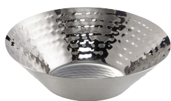
Brotkorb/Obstschale Bread/food basket Hammerschlag-Optik, Edelstahl hammered design, stainless steel

520030 Ø 163mm H 50mm 520031 Ø 198mm H 55mm