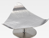
Ministänder auf Fuß Mini stand on foot Hammerschlag-Optik, Edelstahl hammered design, stainless steel