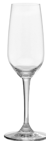
Champagne flute / Champagnerflöte / Flûte à Champagne / Copa de Champagne / Calice da Champagne