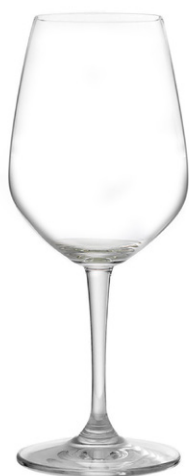
Red wine glass / Rotweinglas / Verre à vin rouge / Copa de vino tinto / Calice di vino rosso

It La serie contemporanea per eccellenza dai contorni spigolosi, dalle capienze e dalle proporzioni particolarmente generose. I bicchieri sono robusti e solidi, ma non scendono a compromessi con l'estetica e i piaceri della degustazione, grazie soprattutto ai bordi particolarmente sottili.