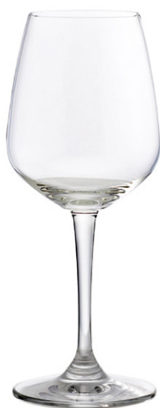
Red wine glass / Rotweinglas / Verre à vin rouge / Copa de vino tinto / Calice di vino rosso