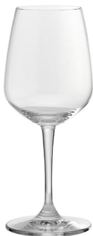
Water goblet / Wasserglas / Verre à eau / Copa de agua / Calice da acqua