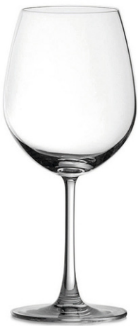
Bordeaux glass / Bordeauxglas / Verre à Bordeaux / Copa de Bordeaux / Calice da Bordeaux

It Il design classico ed elegante della linea Madison presenta un bordo sottile che migliora notevolmente l'esperienza gustativa. La coppa sovradimensionata aumenta la superficie di contatto del vino con l'aria, permettendogli di esprimere tutti i suoi aromi durante la rotazione del calice. I bicchieri da vino più grandi riescono anche a rendere ancora più piacevole la degustazione.