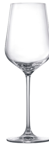
Cabernet glass / Cabernetglas / Verre à Cabernet / Copa de Cabernet / Calice da Cabernet