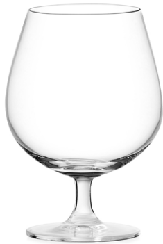
Cognac glass / Cognacglas / Verre à cognac / Copa de coñac / Bicchiere da cognac