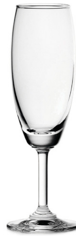
Champagne flute / Champagnerflöte / Flûte à Champagne / Copa de Champagne / Calice da Champagne