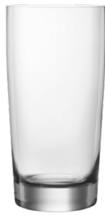
Highball tumbler / Highball Becher / Gobelet Highball / Vaso Highball / Bicchiere Highball