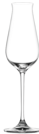
SPARKLING Sparkling wine glass / Schaum- weinglas / Flûte à vin pétillant / Flauta de vino espumoso / Flute da spumante