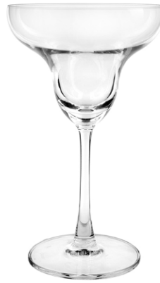
Margarita glass / Margaritaglas / Verre à margarita / Copa de margarita / Calice da margarita