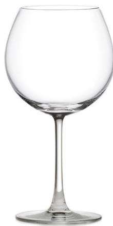
Burgundy glass / Burgunderglas / Verre à Bourgogne / Copa de Bourgogne / Calice da Bourgogne