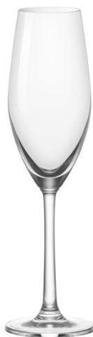
Champagne flute / Champagnerflöte / Flûte à Champagne / Copa de Champagne / Calice da Champagne