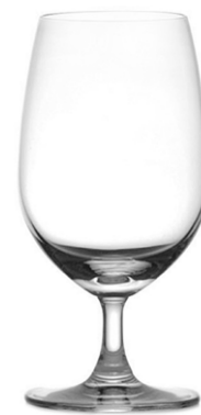
Water goblet / Wasserglas / Verre à eau / Copa de agua / Calice da acqua