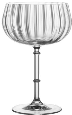
Cocktail coupe / Cocktailschale / Coupe à cocktail / Copa de cóctel / Calice da cocktail

It La linea Rims Orient rievoca la lussureggiante foresta pluviale dell'Asia sudorientale, con il suo inarrestabile monsone umido, e richiama l'immagine di argini traboccanti. Rims Orient è stata creata per soddisfare le reali esigenze dei bar di alto livello e sviluppata da Lucaris in collaborazione con Thomas Anostam, il noto consulente creativo per l'ospitalità in Asia.