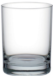
Rocks tumbler / Rocks-Becher / Gobelet rocks / Vaso rocks / Bicchiere rocks