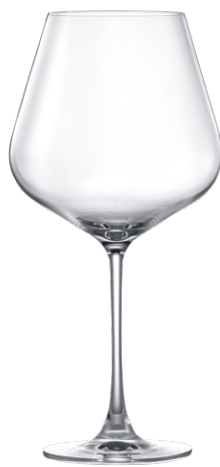
Burgundy glass / Burgunderglas / Verre à Bourgogne / Copa de Bourgogne / Calice da Bourgogne