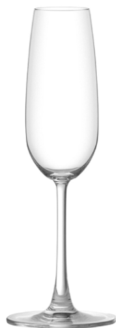
Champagne flute / Champagnerflöte / Flûte à Champagne / Copa de Champagne / Calice da Champagne