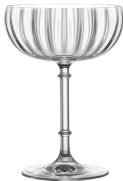
Cocktail coupe / Cocktailschale / Coupe à cocktail / Copa de cóctel / Calice da cocktail