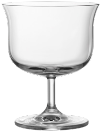
Cocktail coupe / Cocktailschale / Coupe à cocktail / Copa de cóctel / Calice da cocktail