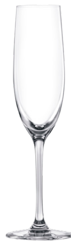
Champagne flute / Champagnerflöte / Flûte à Champagne / Copa de Champagne / Calice da Champagne