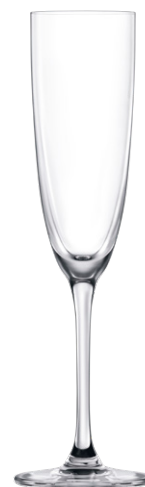
Champagne flute / Champagnerflöte / Flûte à Champagne / Copa de Champagne / Calice da Champagne