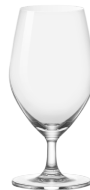
Water goblet / Wasserglas / Verre à eau / Copa de agua / Calice da acqua