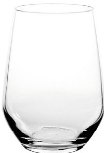
Highball tumbler / Highball Becher / Gobelet Highball / Vaso Highball / Bicchiere Highball