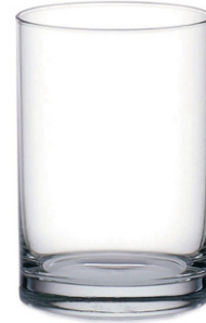
Juice tumbler / Saftbecher / Gobelet à jus / Vaso de jugo / Bicchiere da succo