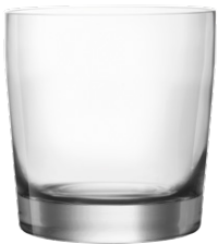
Lowball tumbler / Lowball Becher / Gobelet Lowball / Vaso Lowball / Bicchiere Lowball

La linea Rims è semplice a prima vista e complessa a uno sguardo più attento. Capace di esprimere tutto il suo potenziale solo una volta riempita e pronta per essere servita, questa linea di pregiati bicchieri da bar in cristallo lascia libero spazio alla creatività, senza interferenze, mettendo al centro della scena il locale e il concetto che esso rappresenta.