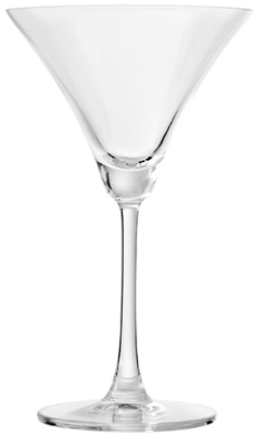
Cocktail glass / Cocktailglas / Verre à cocktail / Copa de cóctel / Calice da cocktail