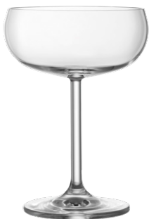
Cocktail coupe / Cocktailschale / Coupe à cocktail / Copa de cóctel / Calice da cocktail