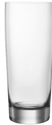
Quencher tumbler / Quencher- becher / Gobelet Quencher / Vaso Quencher / Bicchiere Quencher