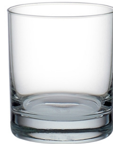
Double rocks tumbler / Double Rocks-Becher / Gobelet double rocks / Vaso double rocks / Bicchiere double rocks