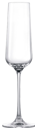
Champagne flute / Champagnerflöte / Flûte à Champagne / Copa de Champagne / Calice da Champagne