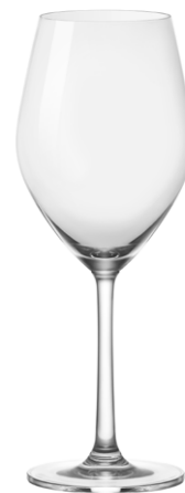
Red wine glass / Rotweinglas / Verre à vin rouge / Copa de vino tinto / Calice di vino rosso