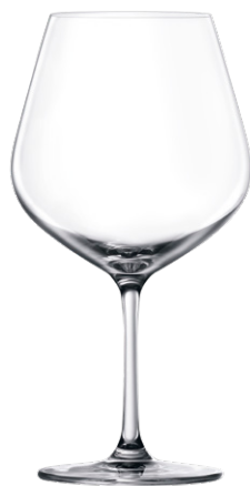
Burgundy glass / Burgunderglas / Verre à Bourgogne / Copa de Bourgogne / Calice da Bourgogne