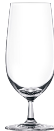
Beer glass / Bierglas / Verre à bière / Copa de cerveza / Bicchiere da birra LS03BR14 Ø 7.6cm/Ht. 18.2cm/Cont. 39.5cl 6