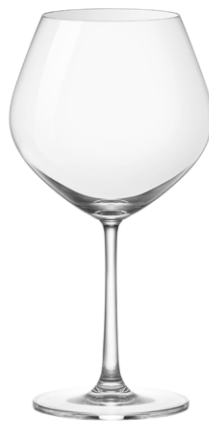
Burgundy glass / Burgunderglas / Verre à Bourgogne / Copa de Bourgogne / Calice da Bourgogne