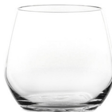
Rocks tumbler / Rocks-Becher / Gobelet rocks / Vaso rocks / Bicchiere rocks