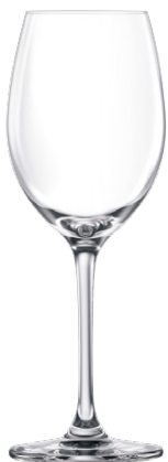
Riesling glass / Rieslingglas / Verre à Riesling / Copa de Riesling / Calice da Riesling