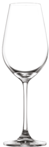
CRISP White wine glass / Weißweinglas / Verre à vin blanc / Copa de vino blanco / Calice da vino bianco

LS10CW13 Ø 7.7cm/Ht. 23.5cm/Cont. 36.5cl