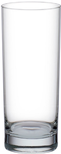
Long drink tumbler / Longdrink-becher / Gobelet à long drink / Vaso de trago largo / Bicchiere da long drink

Lo spessore del fondo assicura una migliore stabilità: è il bicchiere multiuso perfetto per birrerie, bar, hotel e ristoranti. Il volume si adatta ai bisogni dei professionisti per la preparazione di cocktail o per servire succhi di frutta e soda.