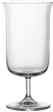
Cocktail glass / Cocktailglas / Verre à cocktail / Copa de cóctel / Calice da cocktail