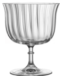
Cocktail coupe / Cocktailschale / Coupe à cocktail / Copa de cóctel / Calice da cocktail