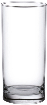
Long drink tumbler / Longdrinkbecher / Gobelet à long drink / Vaso de trago largo / Bicchiere da long drink

La serie economica e performante ideale per servire succhi, soda, acqua e long drink. I prodotti sono pensati per un uso intensivo nella ristorazione collettiva o commerciale.