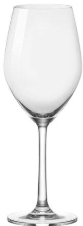
White wine glass / Weißweinglas / Verre à vin blanc / Copa de vino blanco / Calice di vino bianco