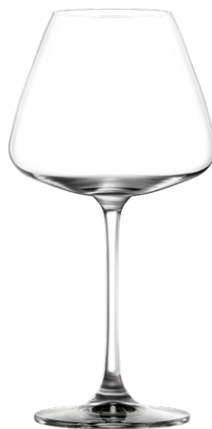
ELEGANT Red wine glass / Rotweinglas / Verre à vin rouge / Copa de vino tinto / Calice da vino rosso