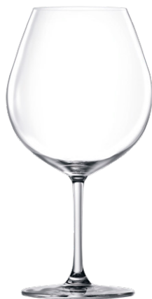
Burgundy glass / Burgunderglas / Verre à Bourgogne / Copa de Bourgogne / Calice da Bourgogne