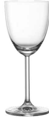
Cocktail glass / Cocktailglas / Verre à cocktail / Copa de cóctel / Calice da cocktail