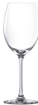
Chardonnay glass / Chardonnayglas / Verre à Chardonnay / Copa de Chardonnay / Calice da Chardonnay