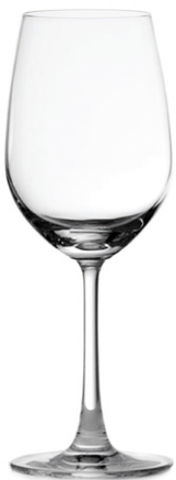
White wine glass / Weißweinglas / Verre à vin blanc / Copa de vino blanco / Calice di vino bianco