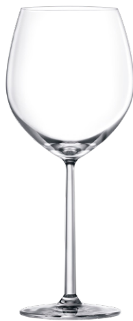
Burgundy glass / Burgunderglas / Verre à Bourgogne / Copa de Bourgogne / Calice da Bourgogne LS03BG23 Ø 10.4 cm/Ht. 24.9cm/Cont. 66.5cl 6