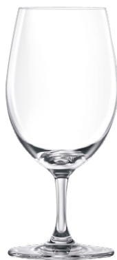
Water goblet / Wasserglas / Verre à eau / Copa de agua / Calice da acqua