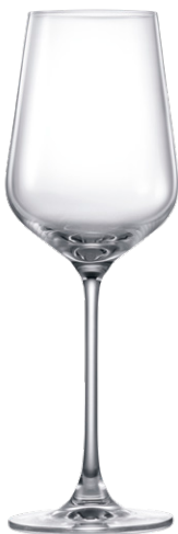
Chardonnay glass / Chardonnayglas / Verre à Chardonnay / Copa de Chardonnay / Calice da Chardonnay