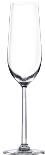
Champagne flute / Champagnerflöte / Flûte à Champagne / Copa de Champagne / Calice da Champagne LS03CP09 Ø 5.9cm/Ht. 26.6cm/Cont. 25cl 6