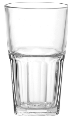
Highball tumbler / Highball Becher / Gobelet Highball / Vaso Highball / Bicchiere Highball